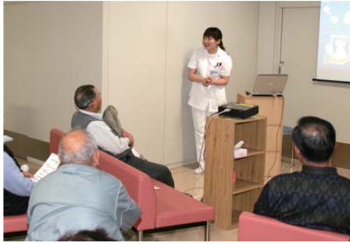
薬剤科 しっかりと管理、きっちり服用 正しい薬の飲み方

また、院外医療講演は各地区の公民館などを会場に開催しております。ご希望がございましたら、当院地域医療連携室までお気軽にお問い合わせください。