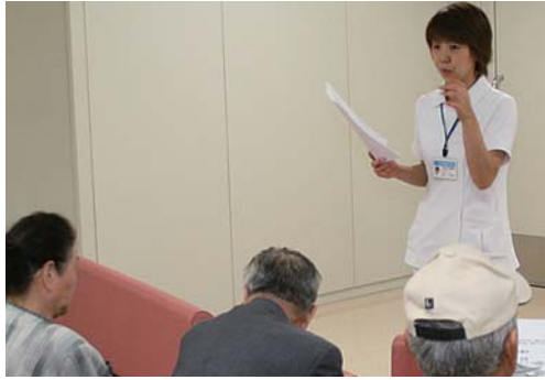
栄養科 低栄養のリスクを防ぐ 高齢者の食事