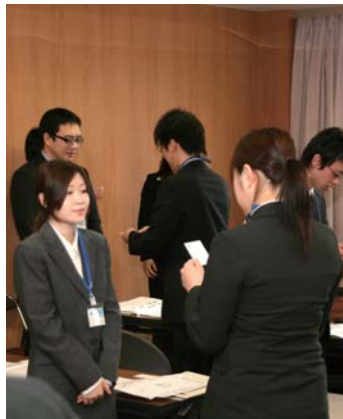
接遇講座 名刺交換の練習