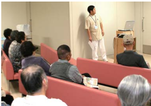
医事課 75歳以上の方、ご確認下さい 後期高齢者医療制度