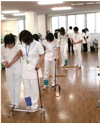
リハビリテーション室で 介助の基本を学ぶ