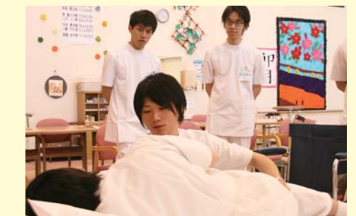
介助の基本を実習中