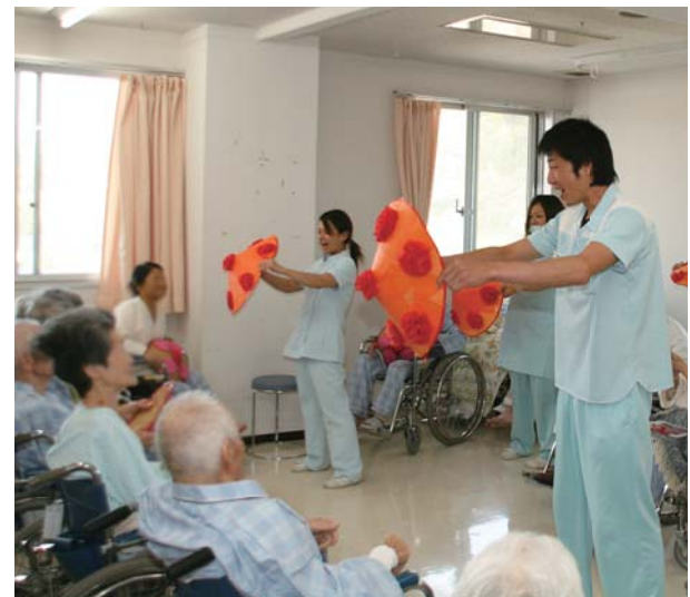
スタッフによる花笠踊り披露

その中でも、患者さんが一番笑顔になっていたのは隣の人とじゃんけんして、バトン代わりにカッターを被せていくというゲーム「かつらりレー」でした。