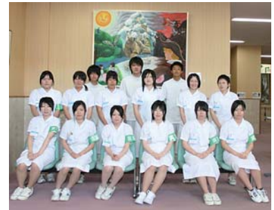
参加者全員で 記念写真