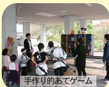
手作りの的あてゲーム