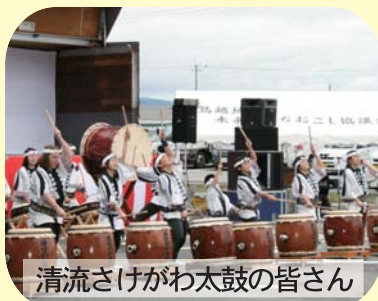
清流さげがわ太鼓の皆さん