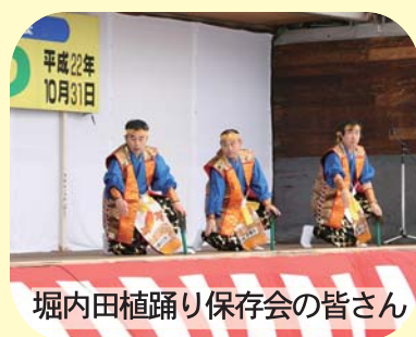
堀内田植踊り保存会の皆さん