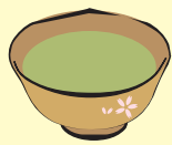
職員によるお茶席