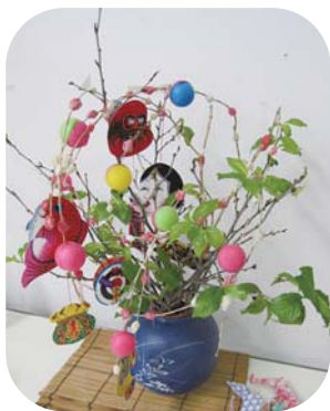
なし団子飾り (2階病棟談話室)