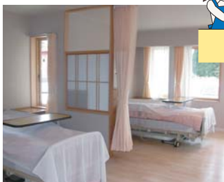
4人室各ベッドに窓があります

梅の里に、新しい老健施設 平成24年5月1日(火)、徳洲会グループは真室川町に介護老人保健施設「梅花苑」を開設いたしました。鉄骨造り平屋建てで、同町木ノ下の特別養護老人ホーム「福寿荘」に隣接。当院は、協力医療機関となります。 同施設では、①施設入所、②短期入所、③通所リハビリテーションのサービスが受けられます。 入所定員は100人(一般棟60人、認知症棟40人)で、個室と4人室がそれぞれ20室あります。また、通所リハビリテーションの定員は20人です。