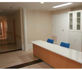
居室前のサブステーション