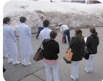
災害対策委員会の消火器訓練