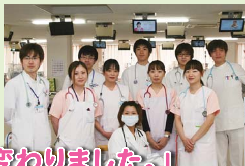
←透析室 「白」の上着は臨床工学技士で「ピンク」の上着が看護師です。

新年度を迎え、看護部では大きな変化がありました。それは「制服の変更」です。これまでと大きく異なるのは、制服の「色」です。男性看護師の上着が「紺」、そして女性看護師の上着が「ピンク」となりました。