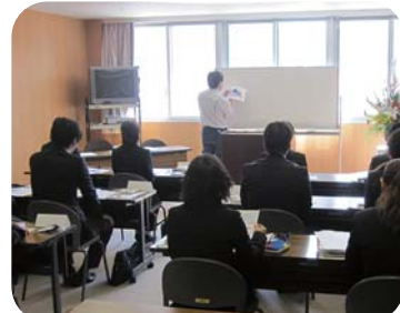
総務課から就業規則等の説明