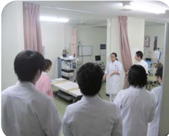
院内見学 内視鏡室