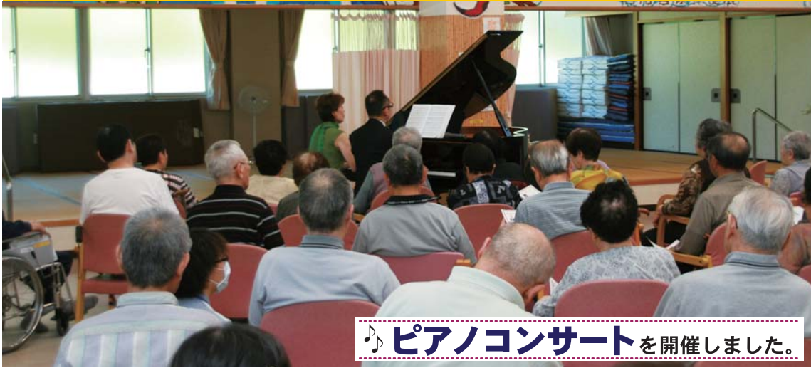
♪ ピアノコンサート を開催しました。