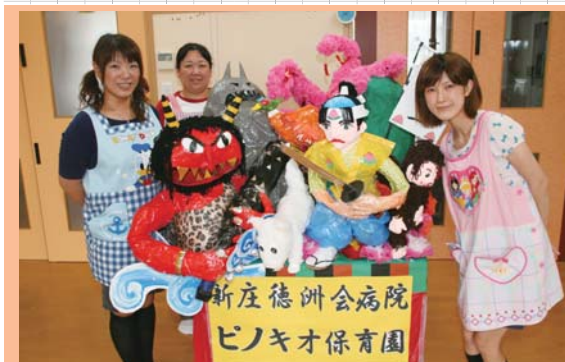
制作した3名のスタッフと手作り山車「桃太郎」

さて、今年は当院付属のピノキオ保育 園にも山車が登場しました。制作したの は保育園のスタッフ3名。制作期間は約 1カ月で、この夏行われた「保育園の夕 涼み会」では新庄囃子に合わせて園庭内 をみんなで引っ張りました。