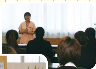
4/1(火) 新入職者に 看護部概要説明

大友絹子前看護部長に比べると、経験も知識もない私ですが、体力には自信があります。病院の理念である、患者さんにとってよい病院・地域の方にとってよい病院・職員にとってよい病院を目指し、日々精進して参りたいと思います。