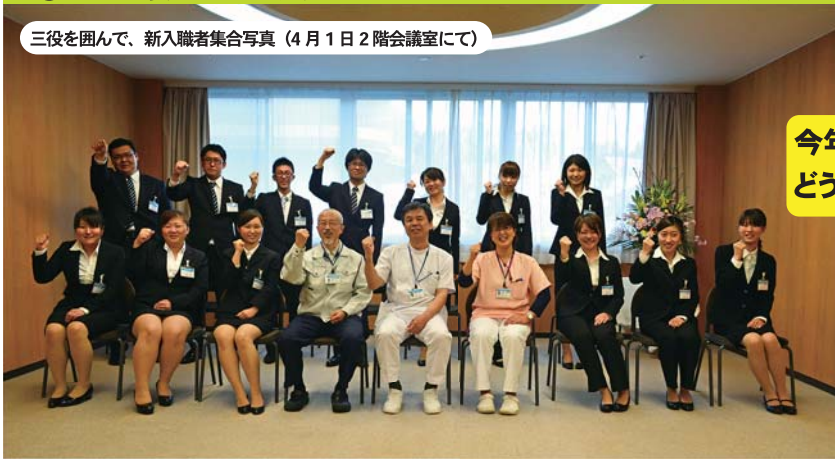
三役を囲んで、新入職者集合写真 (4月1日2階会議室にて)