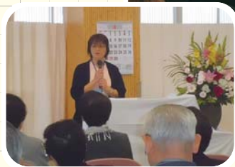
4/13(日) 健康友の会総会にて 挨拶